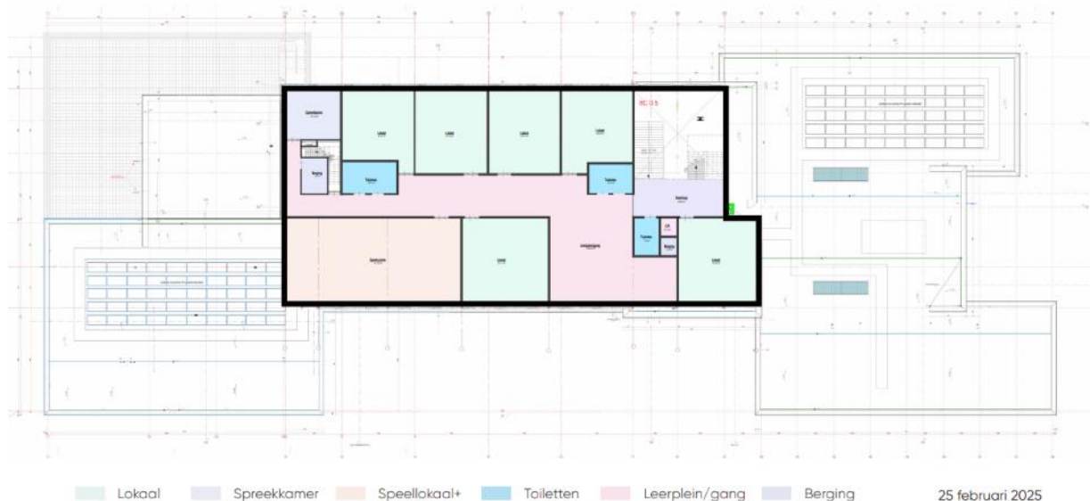
Bovenaanzicht van de uitbreiding (op het bestaande dak) bron: KOW Architecten

Alles afwegende is de keus gevallen op uitbreiding van het bestaande gebouw.