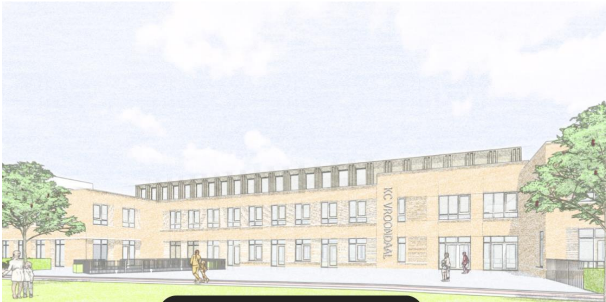
Vooraanzicht van de uitbreiding